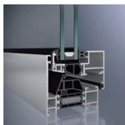
Schüco Ventana AWS 70 BS.HI Schüco Window AWS 70 BS.HI

Schüco Ventana AWS 70 BS.HI Construcción fina de hoja oculta para apariencias de alta calidad.