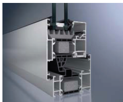
Schüco Ventana AWS 70.HI, con opción de cuña aislante Schüco Window AWS 70.HI, with glazing insulator option

The high-quality window system with a comprehensive range of solutions