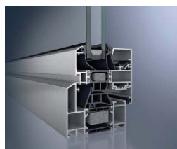
Schüco Fenster AWS 70 RL.HI, versión con el contorno exterior inclinado Schüco Window AWS 70 RL.HI, version with bevelled external contour